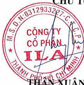
TRẦN XUÂN NGHĨA